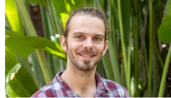
Anton Vidmar Erkenntnistheorie